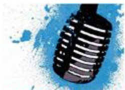
FRANKOFONA PESMA 2013.